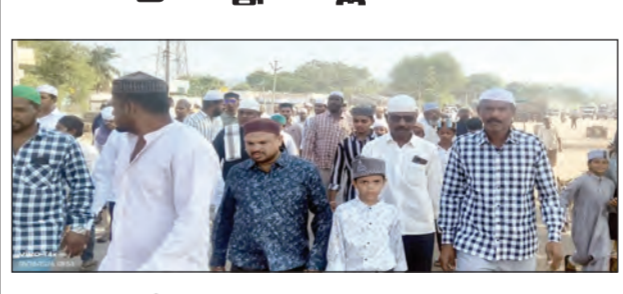
ప్రార్థన కోసం ఈర్ష్యా తరుగుతున్న ముస్లిం సోదరులు