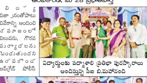
విద్యార్థులకు వచ్చాకాళి ప్రతిభా పురస్కారాలు అందిస్తున్న సీబి బి.మహానంది

పద్మశాలి సేవా సంఘం, పద్మ శాలిని ఉద్యోగుల సేవా సంఘాల బాధ్యులు