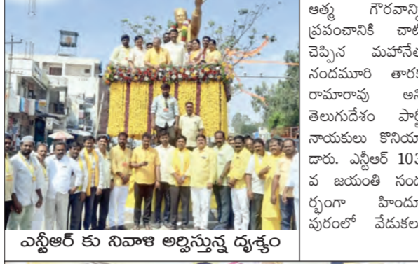
అస్థిఆర్ కు నివాళు అర్పిస్తున్న దృశ్యం