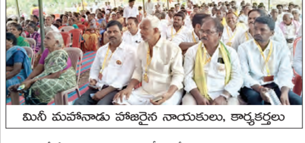
మిగి మహానాడు హాజరైన నాయకులు, కార్యకర్తలు

తెలుగు అత్త గౌరవానికి ప్రతీకగా నిలిచిన స్వర్ణయ నందమూరి తారక రామారావు 103వ జయంతిని తగ్గవల్లి విరవలపల్లి గ్రామంలో తెలుగుదేశం పార్టీ శ్రేణులు అత్యంత వైభవంగా నిర్వహించిన. ఈ కార్యక్రమంలో కేవలం జయంతి వేడుకలు కేవలం కాకుండా గ్రామంలో టీడీపీ శక్తి సామర్థ్య