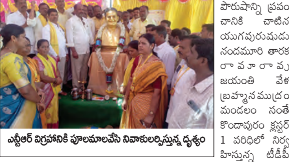
అస్థిఆర్ విగ్రహానికి పూలమాలలు నివాళులర్పిస్తున్న దృశ్యం

సంతోషాంజ్ఞాపురంలో గర్జించిన కూటమి శ్రేణులు అస్థిఆర్ జయంతి పూలమాలలు వేసి నివాళులర్పించిన పాలబండ శ్రీరాములు బ్రహ్మసముద్రం మే 28 ప్రభాతవార్త