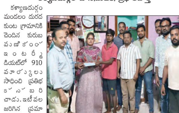
విద్యార్థికి అర్థక సహాయం అందజేస్తున్న దృశ్యం