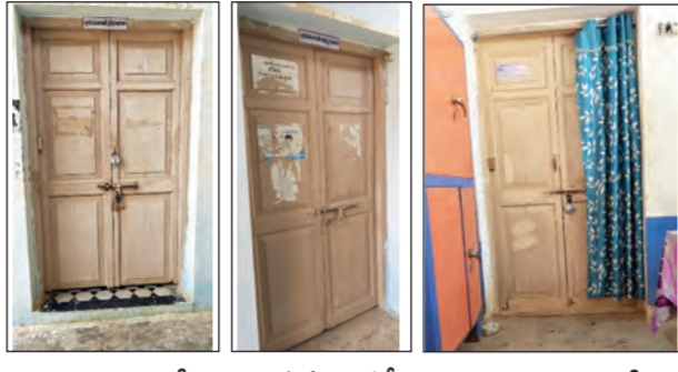
గ్రామ పంచాయతీ ప్రత్యేకాధికారి గది.. ఇక్కడ నిర్లక్ష్యం ప్రత్యేకం గ్రామ పంచాయతీ అభివృద్ధి అధికారి గది.. ఇక్కడ సేవలు గగనం ..దర్శన వేళలు ఏవో..! గ్రామ పంచాయతీ ఈవో గదికి తాళం