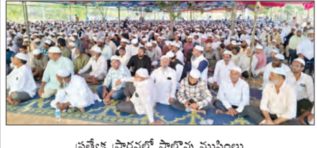
ప్రత్యేక ప్రార్థనల్లో పాల్గొన్న ముస్లింల

ఈర్ష్యా మైదానాలలో ముస్లిం మైనార్టీల ప్రత్యేక ప్రార్థనలు